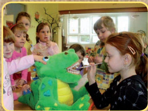
MŠ - „Prevence proti zubnímu kazu“