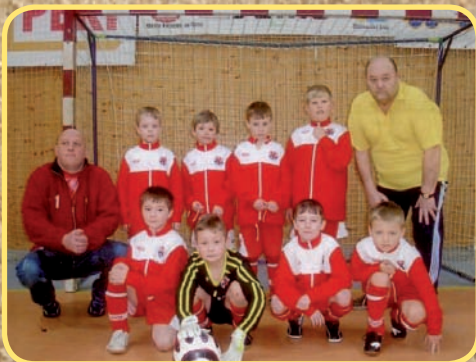
FC Kostelec na Hané - přípravka