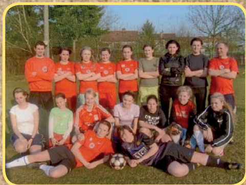
FC Kostelec na Hané - Ženy - Dívky