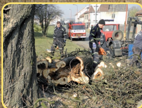
Ztráta dominanty - kaštanu