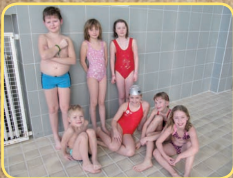
TJ Sokol KnH - Plavecké župní závody