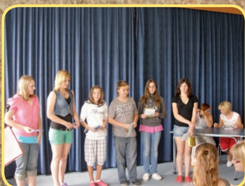
ZŠ - recitační soutěž