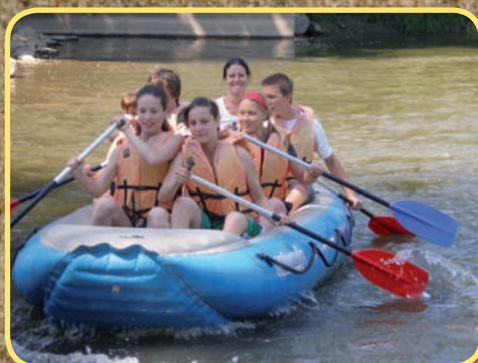
ZŠ - Kurz „GO“ - 8. ročník