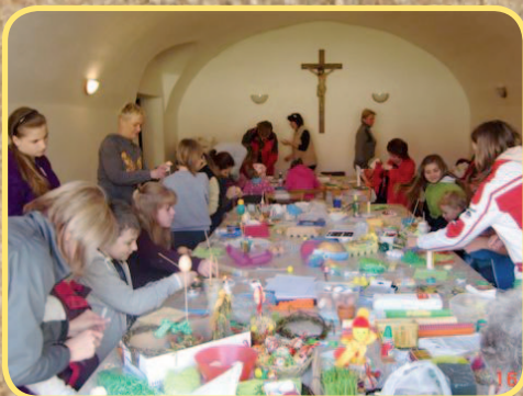
TJ Sokol KnH - Velikonoční výrobky