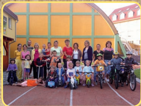
TJ Sokol KnH - Oddíl cvičení rodičů s dětmi