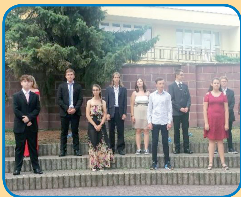
ZŠ - Rozlučka s deváťáky