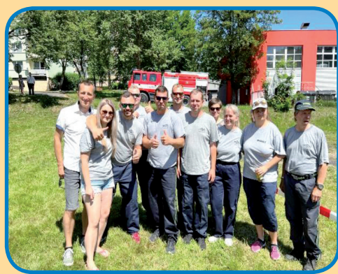
Setkání Kostelců v Červeném Kostelci