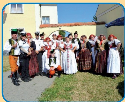
Jakubská pouť 2022