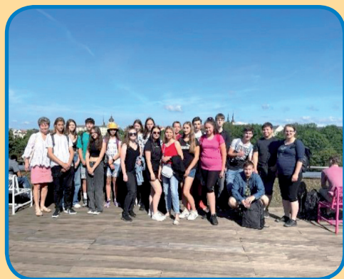
ZŠ - Přírodovědný jarmark