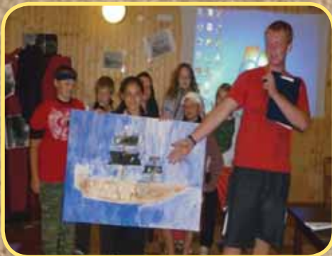
ZŠ - Akce „Mosty“ 6. ročníků