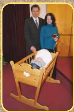
Vítání dětí 26. 11. 2011