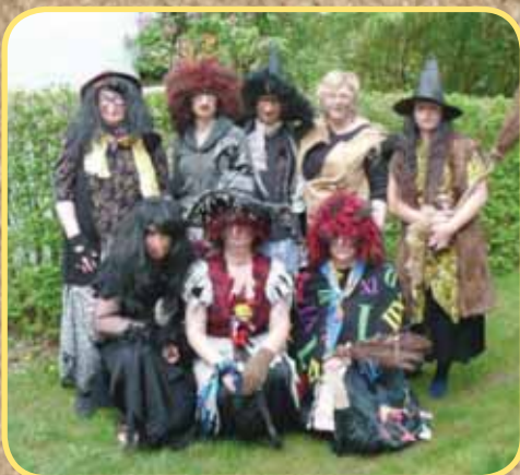
Domov pro seniory KnH