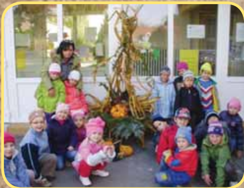
Podzim v MŠ