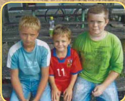
FC Kostelec na Hané