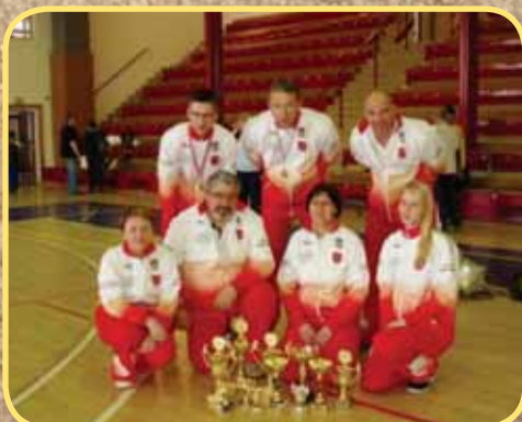
Klub kuší SAVANA