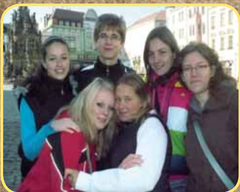
ZŠ - Exkurze Olomouc